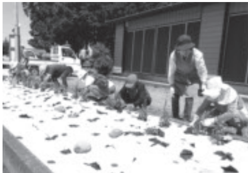
▲栗ヶ島シニアクラブの地域花壇への花植え風景

以下の写真は、活動の一部です。各地区のシニアクラブがそれぞれスポーツ、日帰り宿泊旅行、地域とのふれ合い、地域の清掃、ひとり暮らしの家への訪問活動や困りごとの手伝いを行っています。