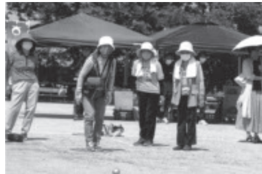
▲多くの会員が参加した町ペタンク大会風景