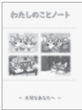
町のエンディングノート「わたしのことノート」