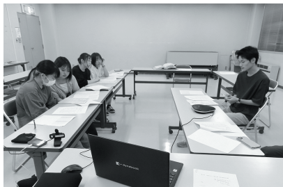
▲令和6年二十歳の集い実行委員会の活動の様子

詳しくは、対象者に送付する案内はがき（11月発送予定）や町ホームページを確認してください。