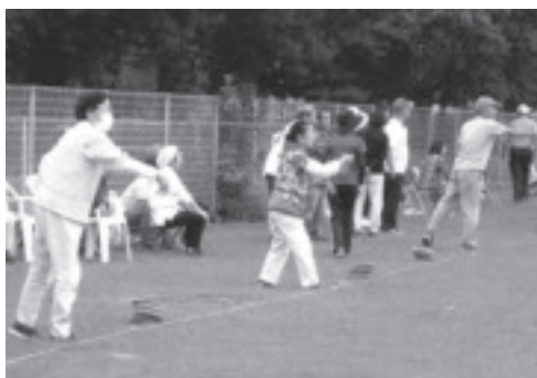
▲スポーツ大会「輪投げ」の競技風景