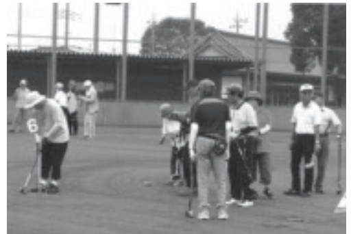
▲スポーツ大会「グラウンド・ゴルフ」の競技風景