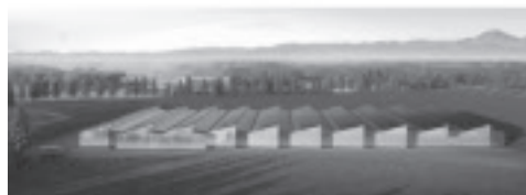
▲高根沢新工場（仮称）イメージ図

医療機器を製造販売するマニー株式会社が取得した、花岡のキリンビール旧栃木工場跡地では、新たな施設整備の準備を進めていましたが、この度、高根沢新工場（仮称）の建設工事がはじまりました。 ◆ 工事期間 （予定） 令和7年1月31日まで ◆ 施設概要 マニー株式会社新工場 （同社医療機器の製造を予定） ◆ その他 工事車両の進入路については、県道宇都宮・那須烏山線沿いの西側の工事ゲートを使用し、左折入場、左折退場とします。 ◆ 地鎮祭の様子 10月17日（火）、マニー株式会社新工場予定地で、地鎮祭が執り行われました。