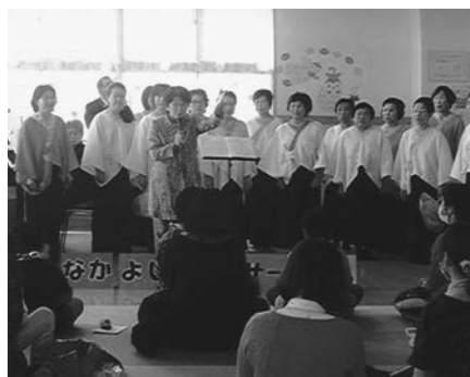
わらべ歌会・童謡ボランティア