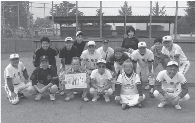
【Cブロック】 《優勝》 光陽台公民館