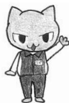
図書館マスコット ミジろう