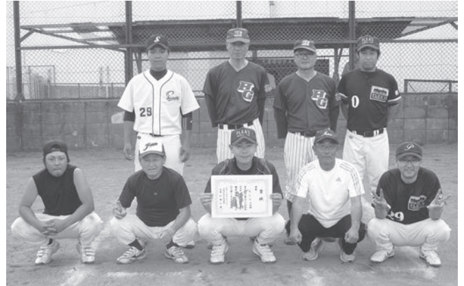
【Bブロック】 《優勝》 東高谷公民館