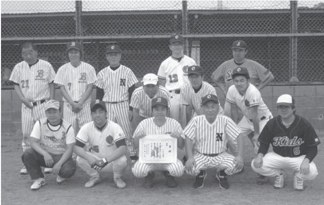
【Aブロック】 《優勝》 大谷公民館