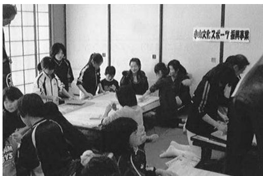
さわやか子ども広場（蕎麦うち教室）