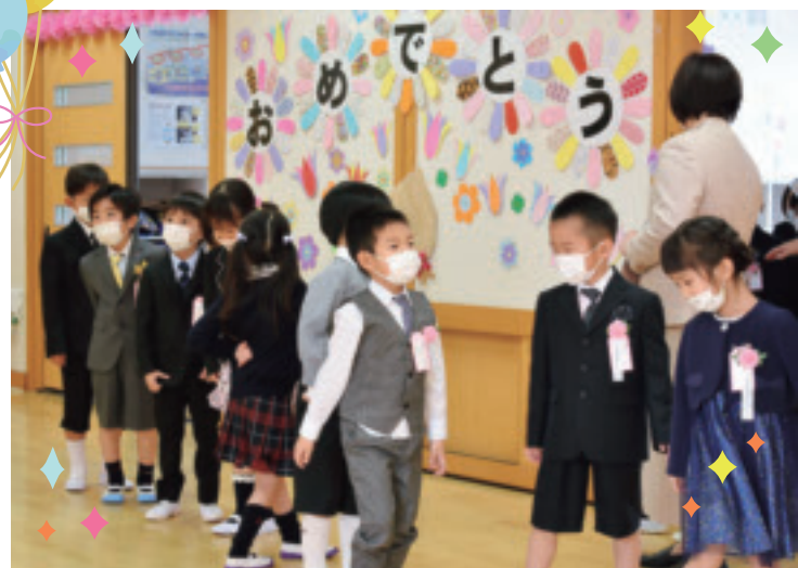
小・中学校の入学式が行われました