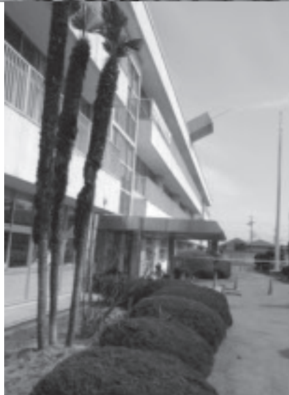
▲時計台が倒壊した旧阿久津小