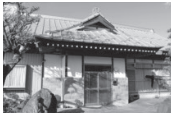
▲震災を経て、瓦の屋根から鋼板の屋根へ

震災後、母屋はとても人が住める状態ではなかったので、比較的被害の少なかった離で生活をしていました。母屋は今住んでいる状態まで修繕するのに4〜5年かかりました。 母屋の修繕にあたって、屋根を瓦から鋼板に変えました。これで地震が起きても、屋根から瓦は落ちてきません。震災を経験したことで、防災の意識が自然と生活の中に生まれてきました。