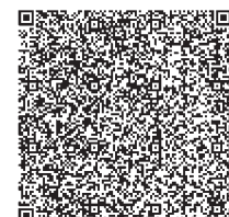
トチギーブックスHP

広報たかねざわが スマホで読める 「マチイロ」 「トチギーブックス」 で検索!!