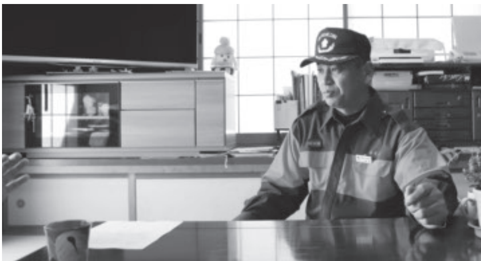
▲団長宅でのインタビューの様子