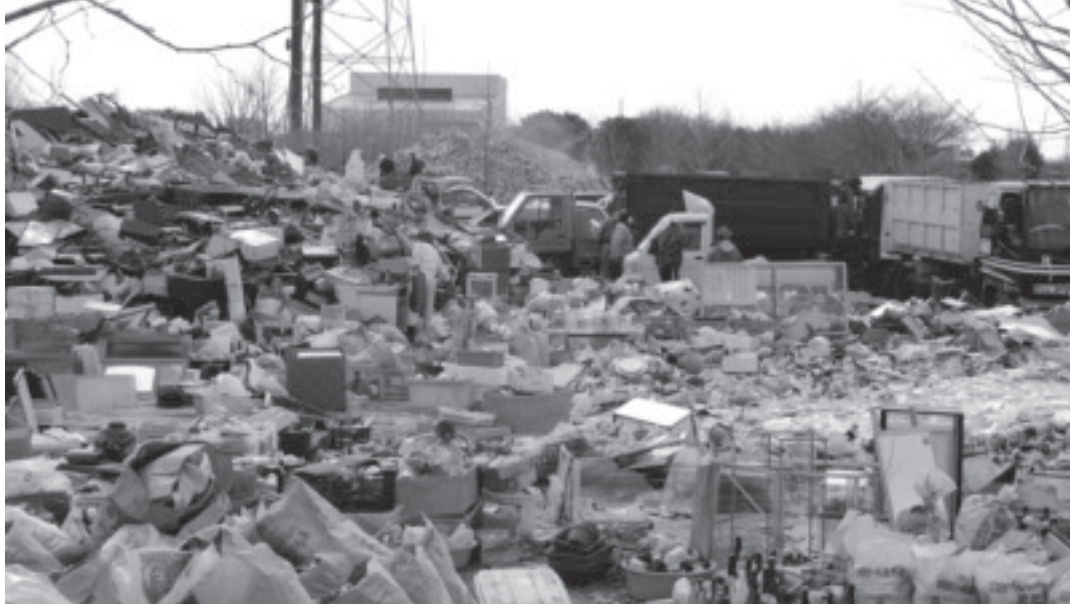
▲町民広場に集まった大量の災害ごみ