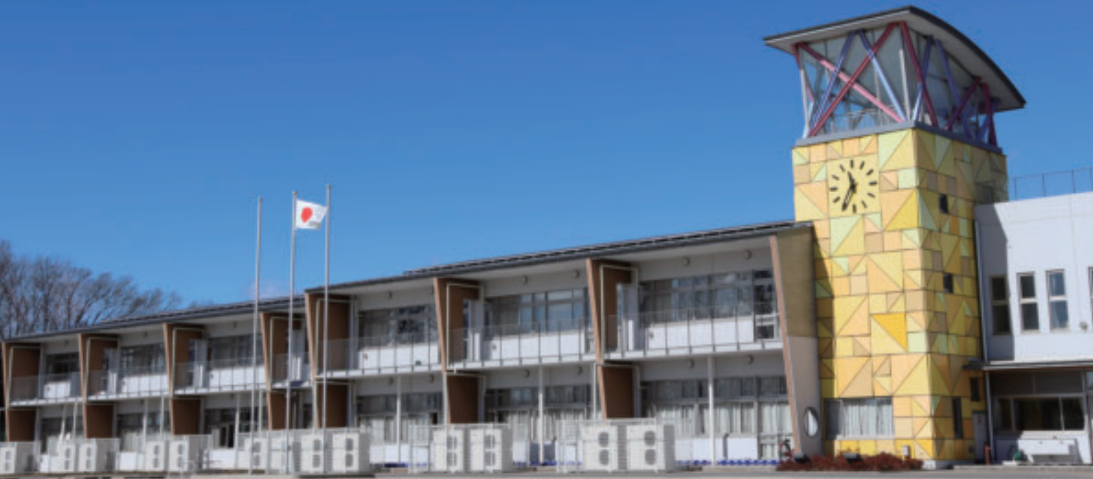
復興のシンボル 阿久津小学校