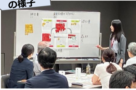
(導入・ゲームルール説明)